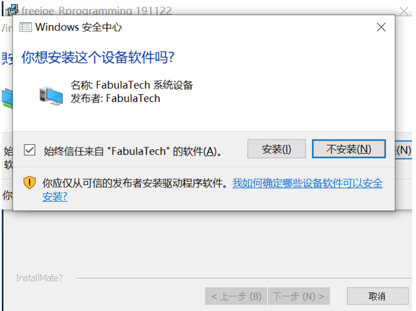
安装界面4，安装虚拟网络驱动：