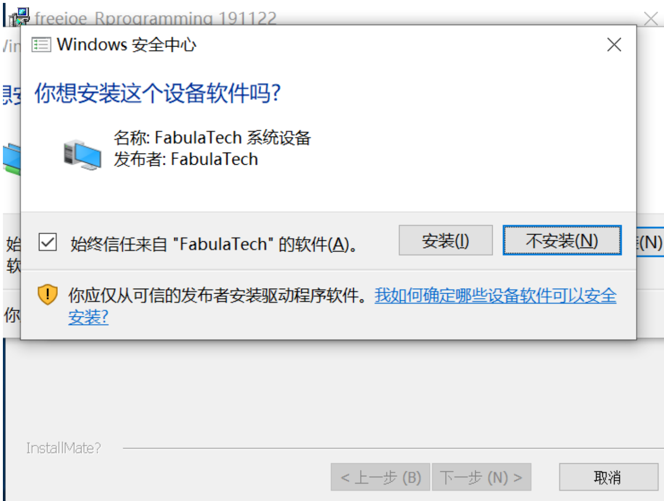
安装界面4，安装虚拟网络驱动：