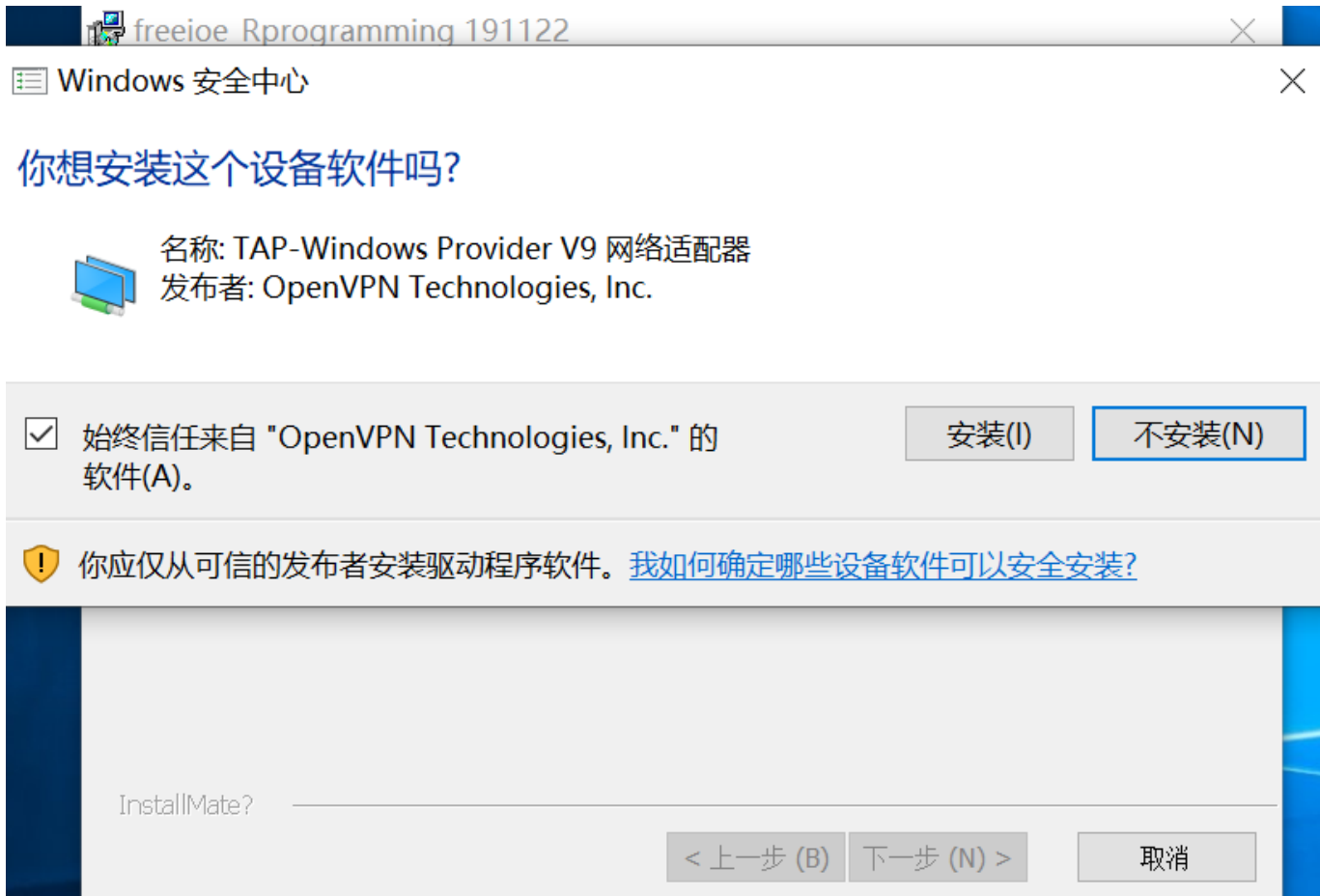
安装界面5，安装虚拟串口驱动2：