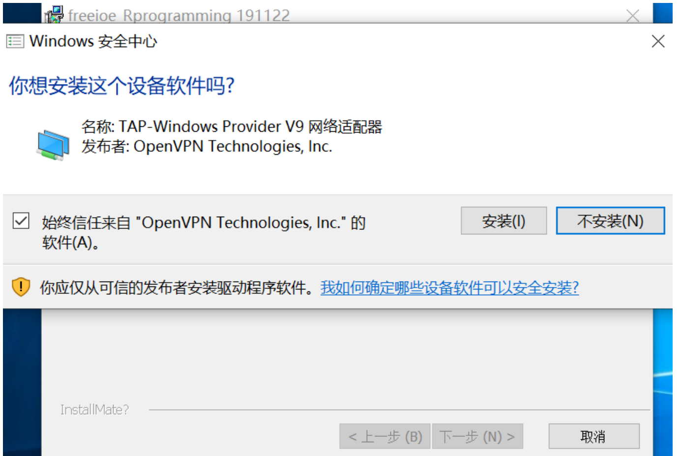
安装界面5，安装虚拟串口驱动2：